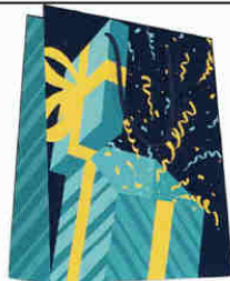
4558CO 4559CO 4560CO