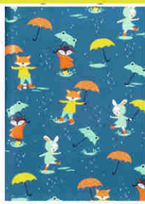
4858CA [ ]