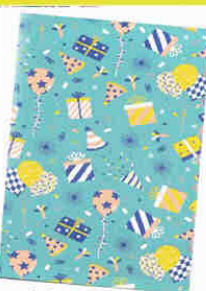
4858CD [ ]