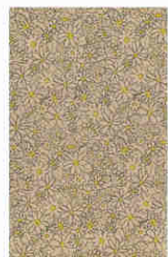
4859NM [ ]