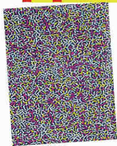
4858DE [ ]