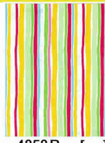
4858 P [ ]